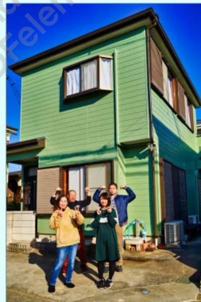
■明るく元気な諸星家の皆さん

脂製の物を使うこともあります。 ●板金部分には通常ステンレスの捻れた釘を使いますが、長い間に不思議と抜けてきます。板金ビスに打ち替えることで板金部材が木部にしっかり固定されて浮き上がりません。台風や地震、強風が