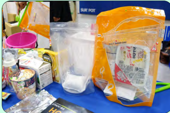
●発熱材と水の科学反応でお湯が湧きます。

■揖保の糸そうめんは食欲の無い時でもツルっとしたのど越しで、昆布出汁が効いて保存食とは思えない美味しさ。アルミ袋を開けると器と箸が入っていて作るのも簡単でわたしの一押しです！！