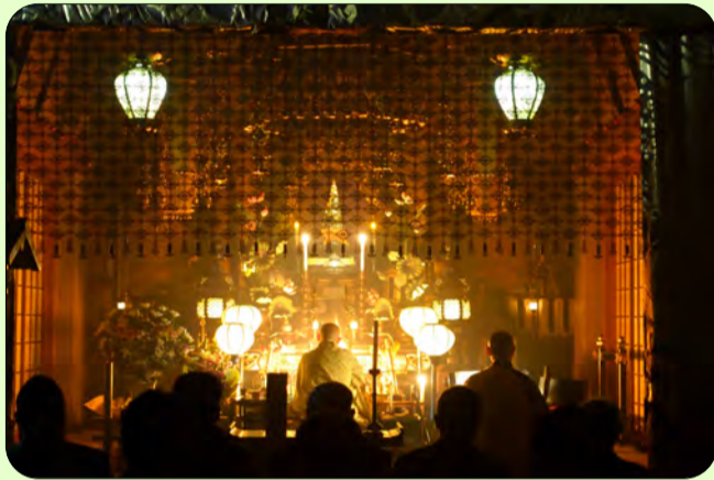
●東大竹光明院で行われた「聖霊会」の様子

■1月22日の早朝、東大竹の光明院で行われた「聖霊会(しょうりょうえ)」に参加しました。厳かな雰囲気の中、和尚さんが護摩木をたき上げ、お経を唱えます。護摩木は太子様へのお供えとして天