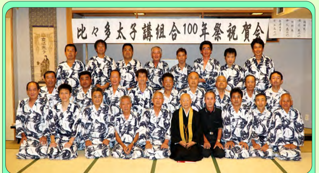
■平成27年(2015年)に100年祭を行った際の集合写真：世代交代して退会したわたしの父親や大工の親方たち、お寺の住職や来賓を招いて盛会でした。

■夜は熱海の旅館に会員が集まり、総会が開かれました。その後の懇親会は、まず太子様の掛け軸にお供え物を上げ、一同で感謝のお辞儀。地業歌(じぎょうた)の木遣り(きやり)を歌うのも習わしです。互いに現場の進捗状況を確認したり、今後の工事の相談をしたりと情報交換の場として活用しています。昔の事を聞くと大工の親方達が一番偉かったそうですが今は違います。上も下もなく皆が平等に力を合わせる事でここまで長く続けてこれたのです。わたしも曾祖父の代から続く比々多太子講組合を大事に繋げていこうと思います！