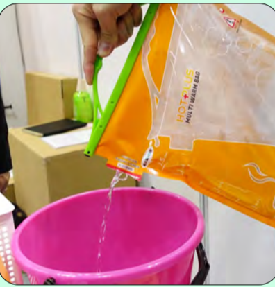
●熱々のお湯を手軽に注げます

■超便利で驚いたのは発熱材と水を化学反応させてお湯を沸かすバッグです。以前、ヒモを引くと温まるお弁当やワンカップがありましたよね？たぶん同じ原理だと思います。お湯だけではなく、バッグに入れたご飯でもタオルでもなんでも温めれます。暖かい食べ物は疲れを癒して免疫力を上げてくれます。