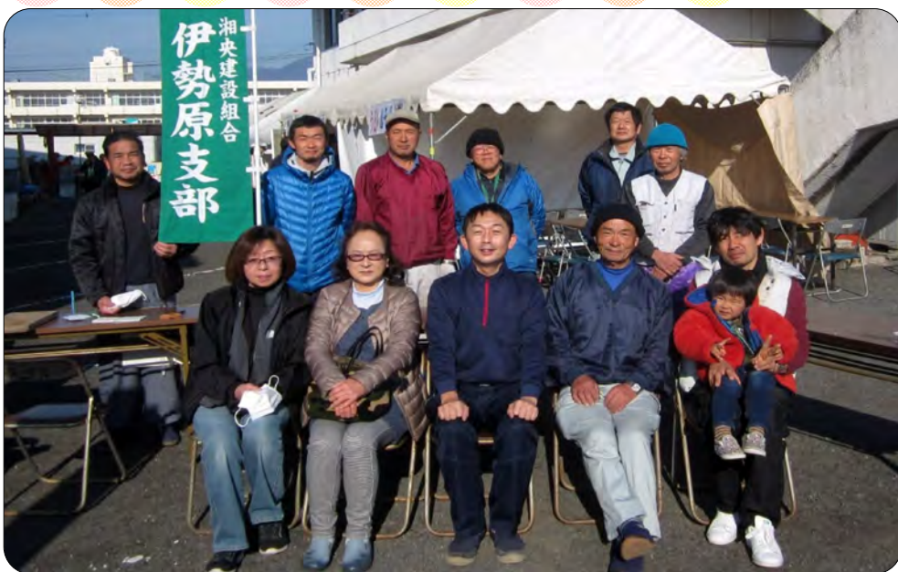
●建設組合のみなさん：大工さん、板金屋さん、造園屋さん、水道屋さん、などなど業種は様々です。

■2月24日(日)に大田地区で開催された大田公民館祭りに参加してきました。わたしが支部長を務める伊勢原支部からは11人が参加をして、受付、包丁研ぎ、まな板削りに分かれて活動をしました。朝9時の受付前から続々と包丁研ぎの依頼がきて、細い果物ナイフから魚をさばく出刃包丁まで色々と研ぎました。