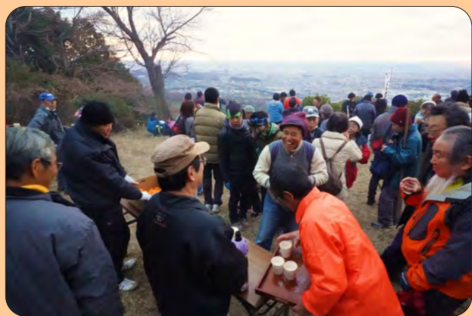
●参拝者の方との触れ合いも大事です

■5月3日（10時～13時）に不動尊御開帳があります、ゴールデンウィークは皆さんも大パノラマを観に参道を登ってみてはいかがでしょうか？