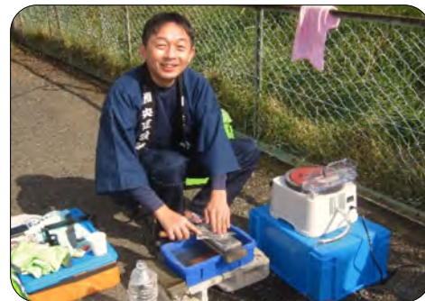
●新品の電動包丁研ぎ器を買ってしまいました！！

■まな板削りは最寄りの平塚工務店さんが機械を使って新品同様に仕上げてくださいました。3時まで包丁75本まな板12枚と刈り込みバサミ1本を仕上げ大反響で終了しました。受取に取りに来たお客さんは大変喜んでとても良かったです。皆さんに、地域活動を通して建設業に興味を持って頂けたら幸いです。