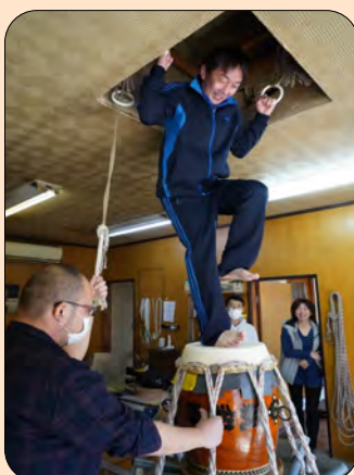
●皮を踏みつけたり、叩いたりして伸ばします。

けませんが頑張り過ぎると膝がガクガクして立てなくなります(笑)30分ほど踏みつけを終えて、最後に音色の確認をしてからお店の方が手際よく作業を行ってくれました。数年に一度の事ですが、自分たちも太鼓作りに関わる事で愛着が湧く感じがしました。清水太鼓屋さんありがとうございました。