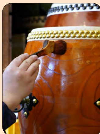
●胴にニス塗って、30分ほど乾かして完成です！！