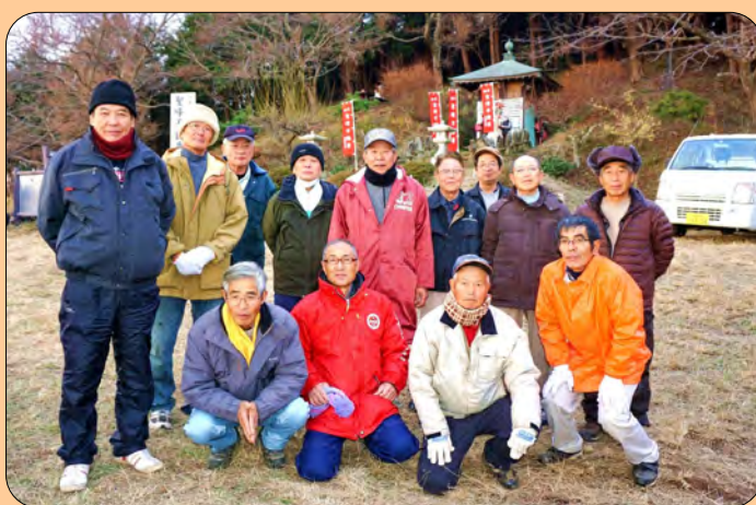
●勇ましい聖峰不動尊世話人会の皆さん