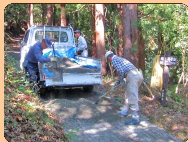
●昨年10月に参道を舗装延長しました