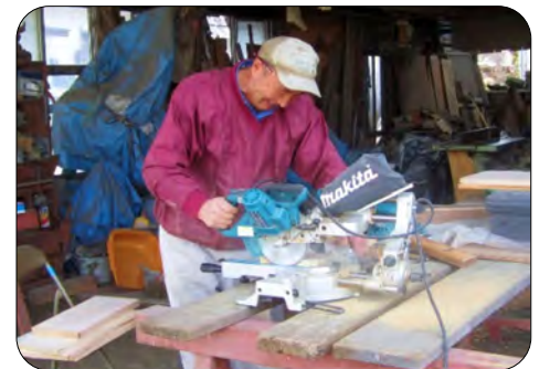
●機械を使ってまな板の小口を切りました。