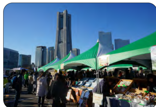
●賑やかな朝市の様子