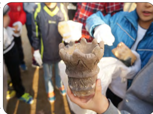
●縄文式土器ソックリに焼き上がりました

■みなさん、四月になったら卒業ですね、おめでとうございます。良い思い出になりましたか？少しですがお役に立てて良かったと思います。■現場の古材も「捨てれば廃棄物」「活かせば燃料」資源を大事にしましょうね!!