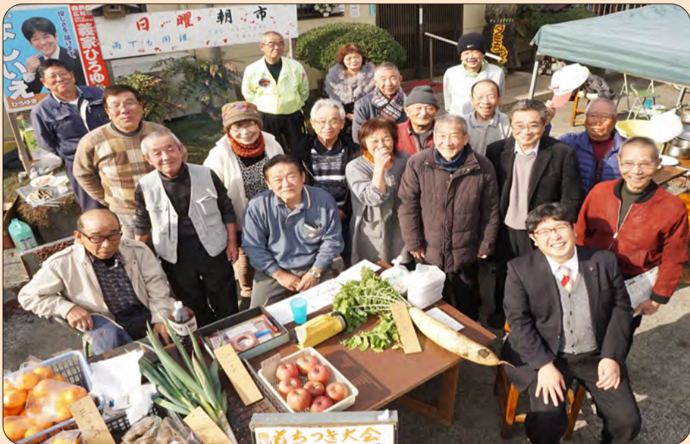
●お店の常連さんと地元の先生達で記念撮影をしました。