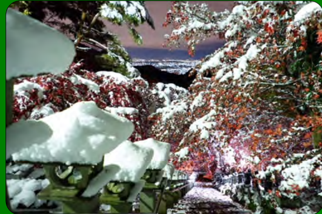
●タイトル：秋雪と夜景 場所：大山寺