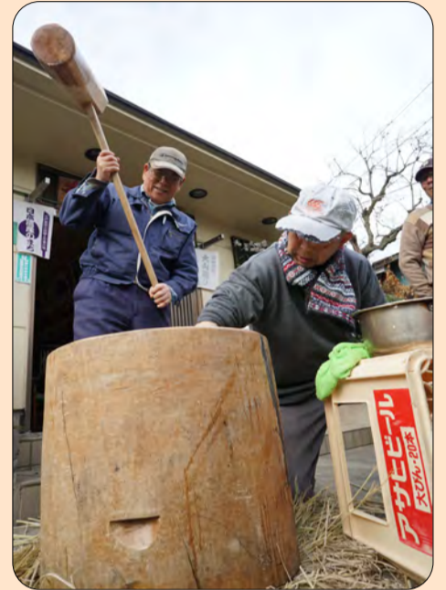
●息ぴったりの常連さん