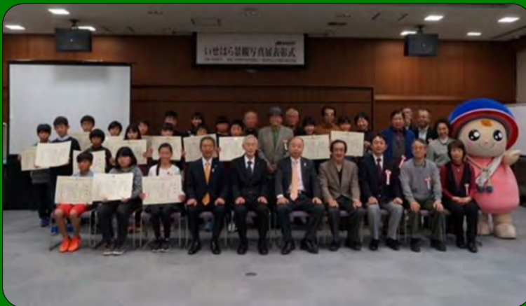
●受賞された38人の皆さんおめでとうございます！