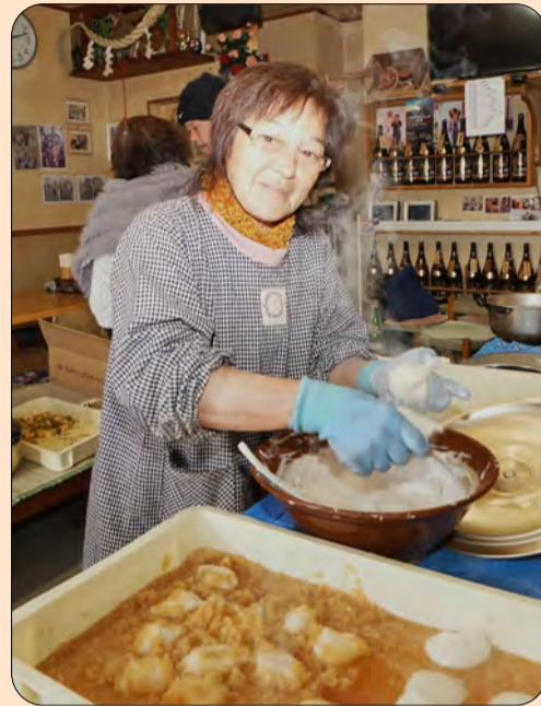
●いつも元気で明るいたみちゃん