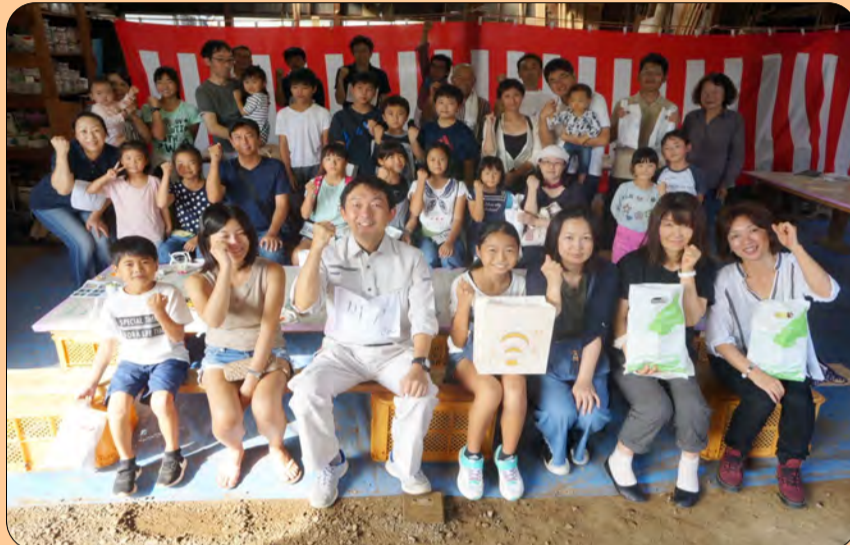
●楽しい時間を過ごせました、皆さんありがとうございます