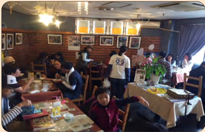
■満員御礼「とっても猫展」店内の様子