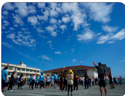
●真っ青な空の下で気持ち良い朝の体操

■10月7日の爽やかな青空の下、比々多小学校で体育祭が行われました。近年は少子高齢化の波を受け、競技種目を不参加する地区が増えてきたので、今大会は規模を縮小して開催しました。■「ムカデ競走」に出ました、もう十五年連続出場している得意種目ですが、わたしの足が