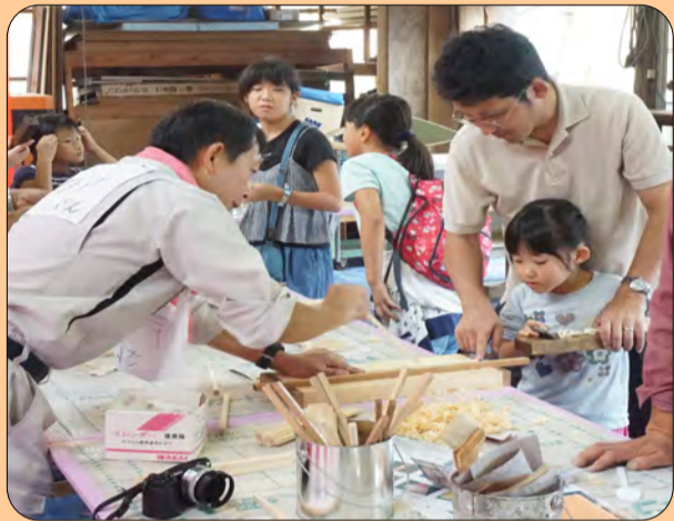
●馴れない手つきでカンナを使うお子さん

■9月16日に川戸工務店作業場で秋のサンマ祭りを開催致しました。ご参加頂いた皆さん、手伝ってくれた職人さんありがとうございました。 ■ひと月前から職人さんと二回のミーティングを行い準備万端！心配していた前日の雨も上がり晴天の開催となりました。今年はチラシ配りなどに力を入れたので、開始時間前から受付に人が並ぶ好スタートがきれました。 ■来場者の皆さんから「炭で焼いたサンマは香ばしくて凄く美味しい！」「焼きたてをその場で食べて最高でした」と喜びに声を沢山頂きました。また、最近串橋に越してきた御夫婦からは「地域の交流の場になって良いですね！」と