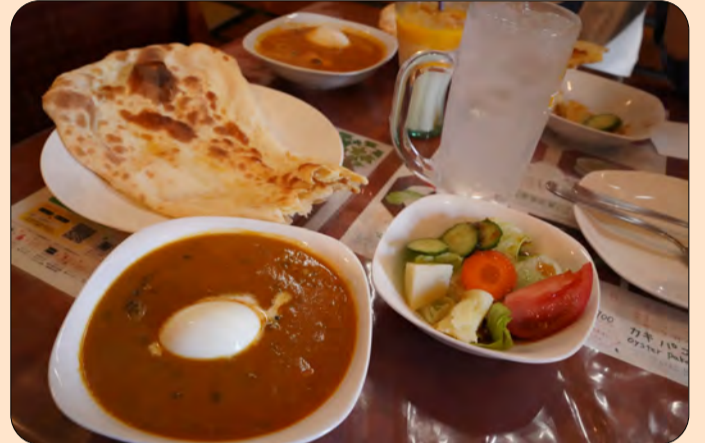
■日替わりランチセットがお得でオススメ