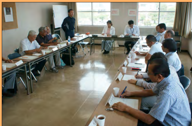
●わたし（左奥）一人ひとつの質問をしました