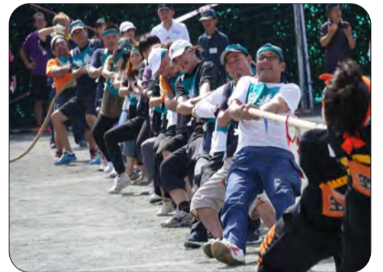
●綱引き一回戦の相手は強豪笠窪（汗）

外れて止まり、再スタートに難儀しました。「油断大敵」ですね、反省。。。 ■地区対抗リレーも盛り上がり事故も怪我も無く楽しい一日を過ごせました。自治会役員、体育普及員の皆さん練習から本番まで、運営ありがとうございました。■優勝は笠窪で10連覇おめでとうございます。