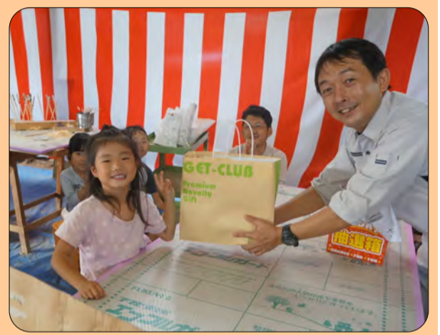
●一位の防災20点セットが当たりました！